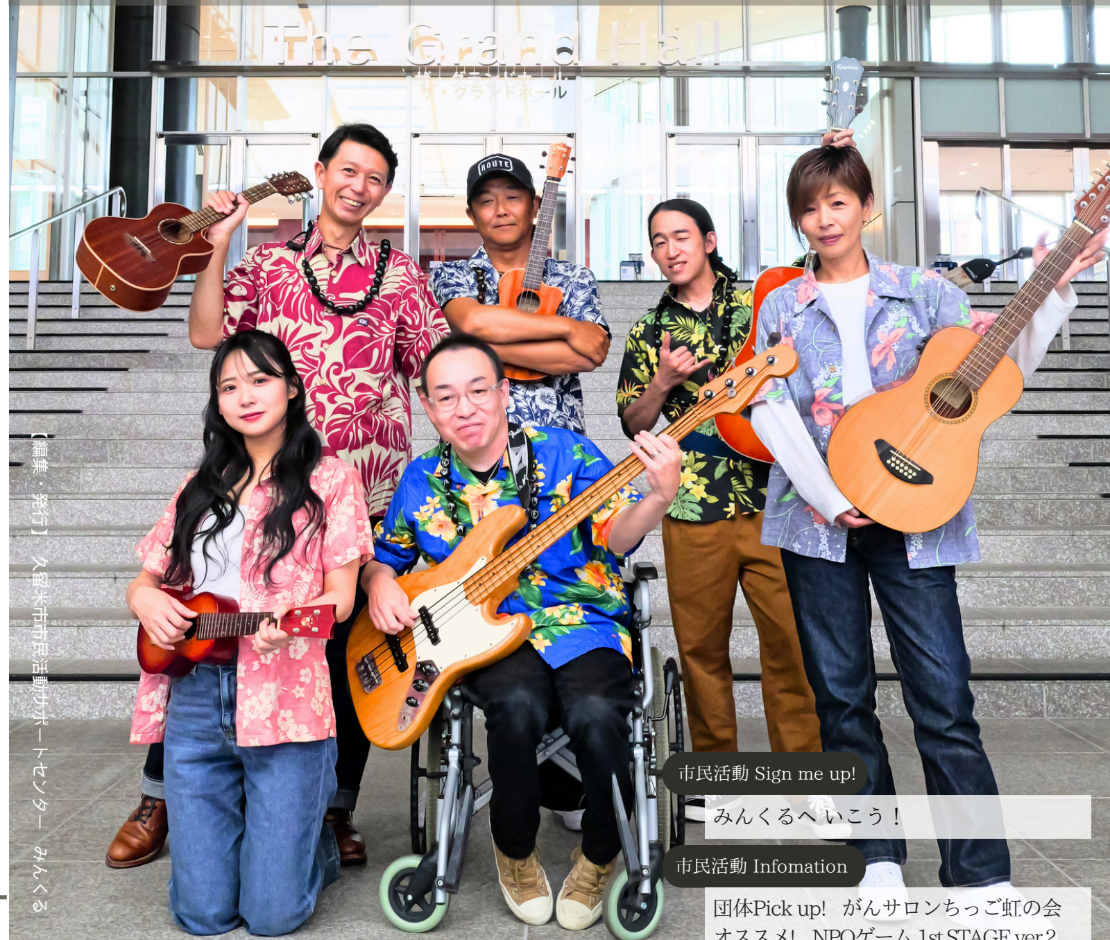
【編集・発行】久留米市市民活動サポートセンター みんくる